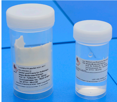
50 ml und Übergefäß