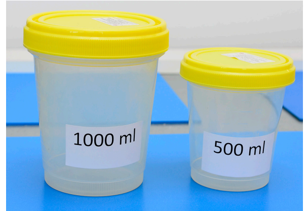
1000 ml und 500 ml