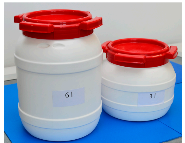
6 l und 3 l