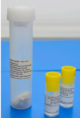
5 ml und Übergefäß